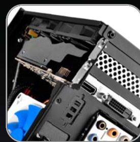
支援雙槽Low-profile 短版顯示卡或擴充卡