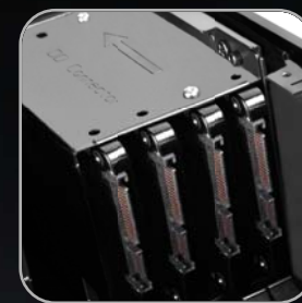
可安裝4顆2.5" 傳統或 固態硬碟