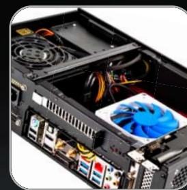
相容於Mini-ITX主機板 與SFX電源