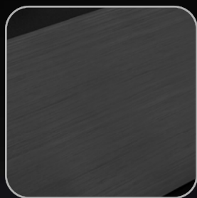
高質感鋁合金髮絲紋面板