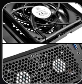
內建1顆120mm 風扇， 另可安裝2顆80mm風扇