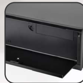
帶鎖門板保障系統安全性