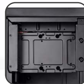
全方位向下相容的磁架設計, 可以減少額外購買轉接磁碟架的費用