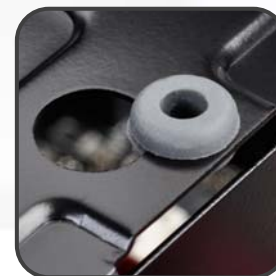
避震設計, 減低噪聲