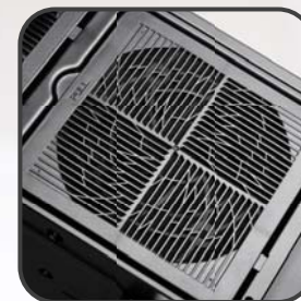
簡易拆除的進氣濾網防止灰塵堆積